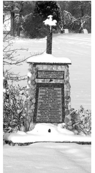
Paminklas 1946 metais žuvusiems partizanams.

Štai toks neeilinis kūrėjas gyvena Pasusienyje, su juo susitikime Kavarsko bažnyčioje prie prakartėlės skulptūrų.