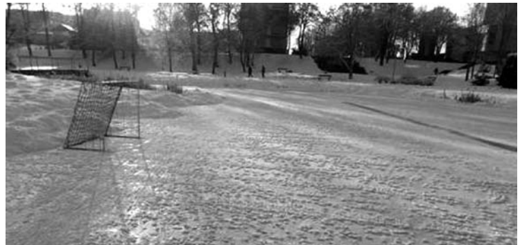
Nevalyta aikštelė nedžiugina.