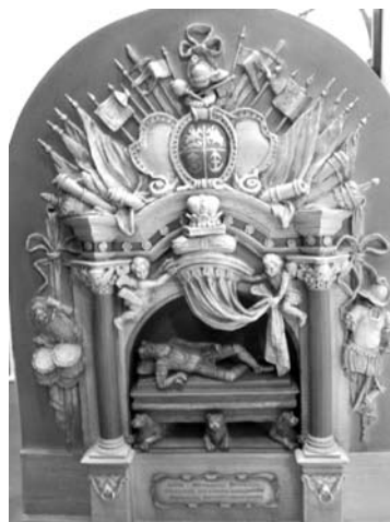
Įspūdingo antkapinio obelisko 1:15 maketą Virginijus Strolia atsivėžė į Lietuvą.